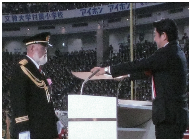
写真3 安倍内閣総理大臣からの表彰

記念式典では、秋本日本消防協会会長により式辞が述べられたのち、永年にわたり消防活動へ多大な貢献のあった消防関係者や、東日本大震災において住民の安全確保や人命救助などの顕著な功績のあった消防機関の関係者等に対し、表彰が行われました。この表彰では、安倍内閣総理大臣から内閣総理大臣表彰（15名・