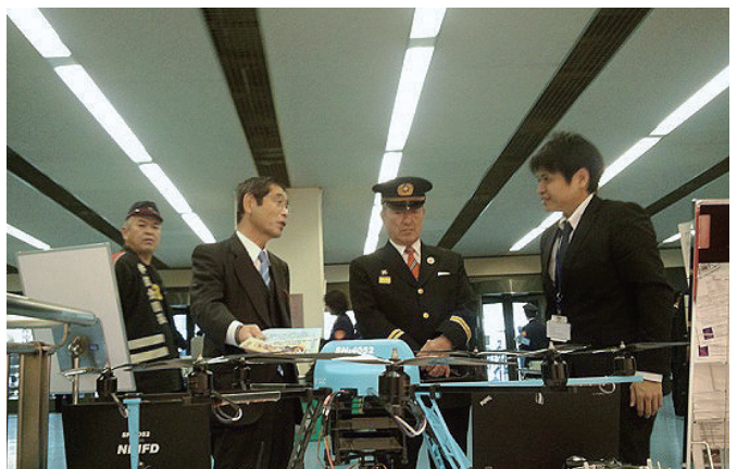
写真6 消防研究センターの展示コーナー (上：消防防災ロボット(FRIGO)、下：無人偵察ヘリ)