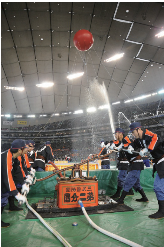
写真4 消防団による放水訓練

記念式典後には、消防団によるラップ隊演奏、放水訓練(写真4)、大地震発生を想定した救急救助訓練などの消防実技が行われるとともに、幼年消防クラブ鼓笛隊の演奏やAKB48による震災復興応援ソングなどが披露され、大会に花を添えました。