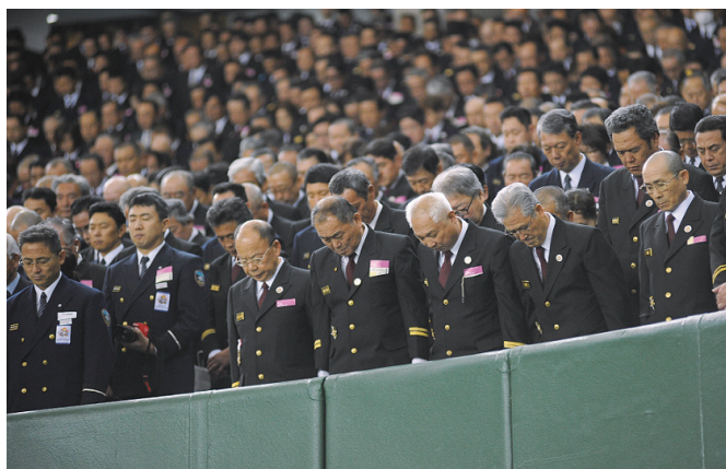
写真2 東日本大震災等で殉職した消防関係者に対する黙祷

オープニングイベントの消防伝統演技ののち、天皇皇后両陛下の御臨席のもと、東日本大震災等の災害で殉職された消防関係者に対して黙祷が捧げられました（写真2）。