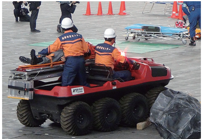
写真5 8輪駆動水陸両用バギー車

大会の最後には、「消防未来宣言」がなされ、自らの地域は自ら守るという先人の熱い思いを受け継ぎ、新しい技術等も積極的に導入しながら、国民の安全を守るためにより強固な未来の日本消防づくりに邁進することが宣言されました。